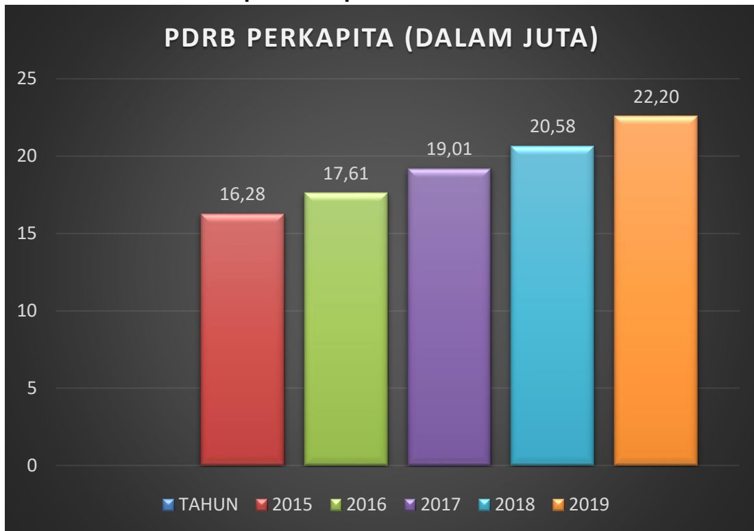
Grafik 3.2 PDRB Per kapita Kabupaten Lebak Tahun 2015-2019

Sumber : Badan Pusat Statistik Kabupaten Lebak